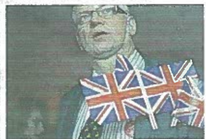
'I really regret my vote': The Brexit voters who voted In

Lustig! Und da soll noch einer sagen dass es nicht eine Me zumindest gedankenloser Wähler/Menschen gibt. Ich denke guten Teil der FPÖ-WählerInnen auch