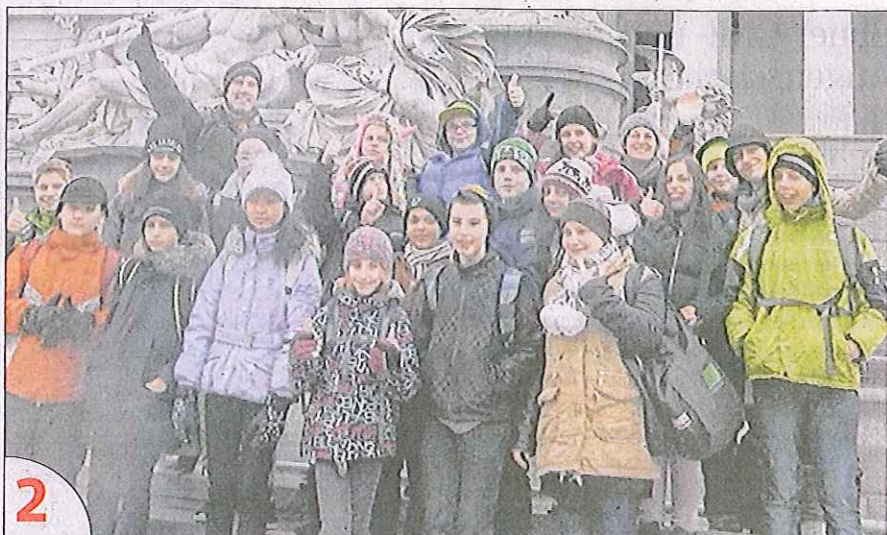
2 Nach dem Besuch des Wiener Eistraumes vor dem Rathaus gab's für die Zweitklassler der Mittelschule Brunn-Maria Enzersdorf die Zeugnisse im Parlament.