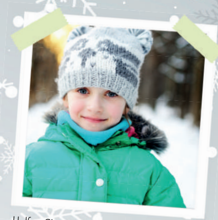
Helpen Sie uns für Kinder, wie Lena auch weiterhin dasein zu können.